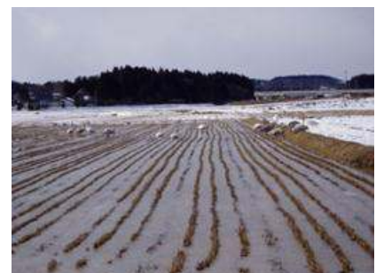
非かんがい期の湛水

また、非かんがい期に田面に小水路状の湛水範囲を確保して、魚類、両生類等の生息場、待避場を確保することも大切です。