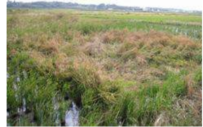
鳥の餌となる植物の栽培

遊休農地等を利用して、鳥の餌となる穀物等を作ります。また、稲刈り後に生える二番穂が生じたままにしておき、鳥の餌にすることができます。