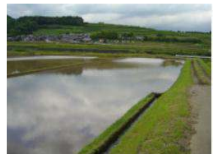
休耕水田への湛水

休耕水田、遊休農地等に湛水することにより、ビオトープとして、魚類、両生類、昆虫類等の生息・繁殖場所として機能するようにします。