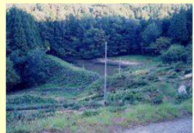
改修前のため池の様子