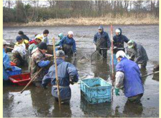
タモ網による外来生物の駆除

I ため池周辺は、散居集落や豊かな生態系が現存する地域であり、大学の研究対象になっていました。近年オオクチバスが増えてきたとの情報があり、ため池の多様な生き物への悪影響を懸念する声が地域で高まりました。