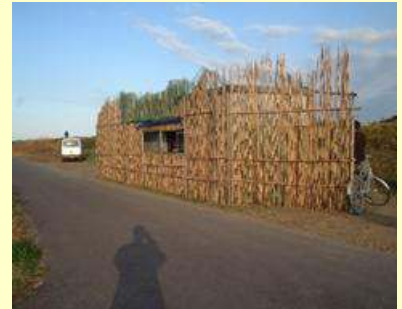
オオヒシクイ監視小屋