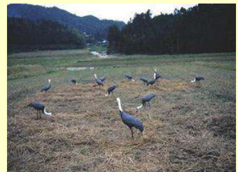
ナベヅルのデコイ