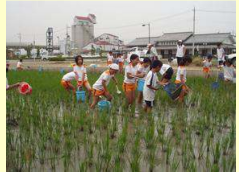
ニゴロブナ放流状況